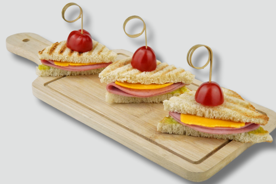
ორაგულითა და კრემ-ყველით