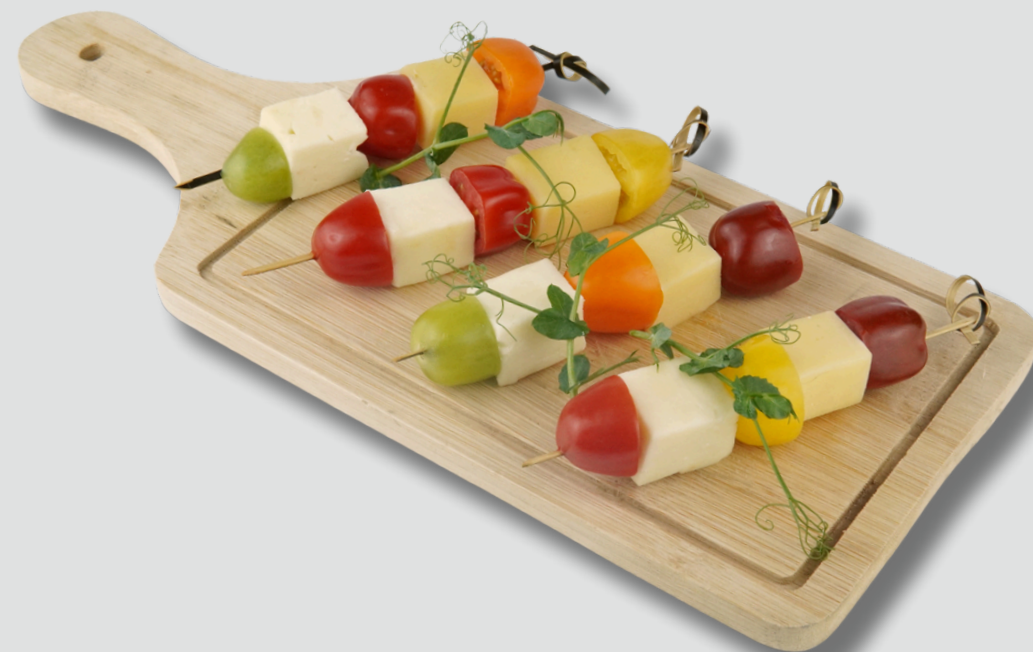
ყველითა (გაუდა, სულუგუნი) და ჩერი პომიდვრით