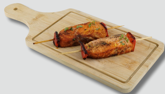
ორაგულის მწვადი ბოსტნეულით