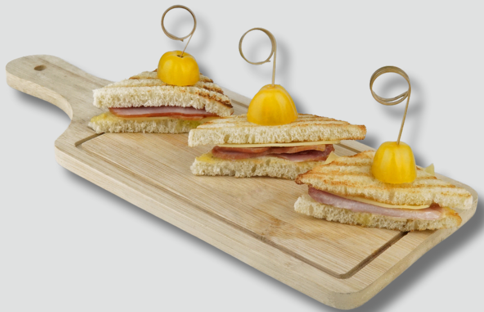
ინდაურით და ჩედარით