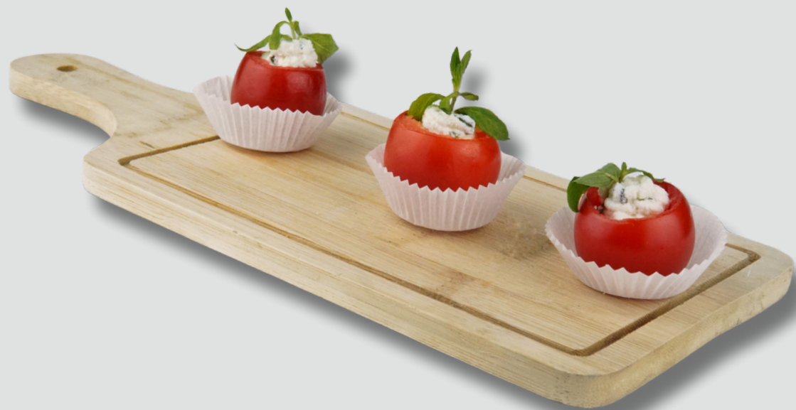
ჩერი პომიდვრითა ნადუღით