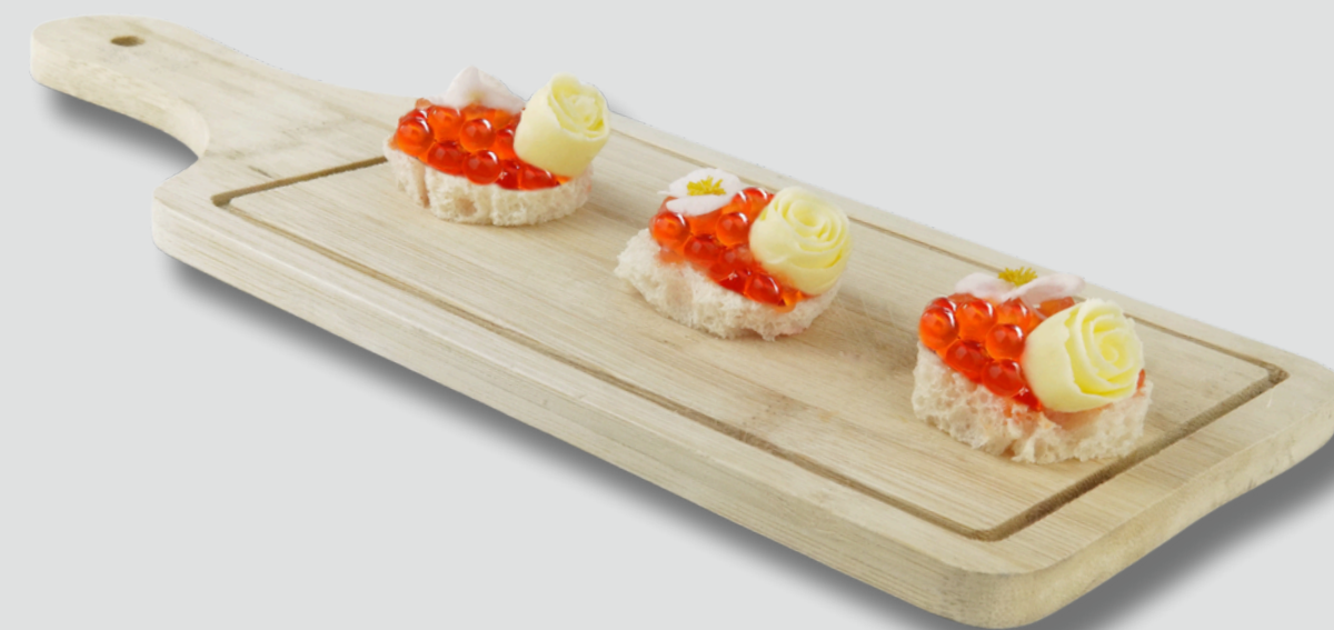
წითელი ხიზილალითა და ნაღების კარაქით