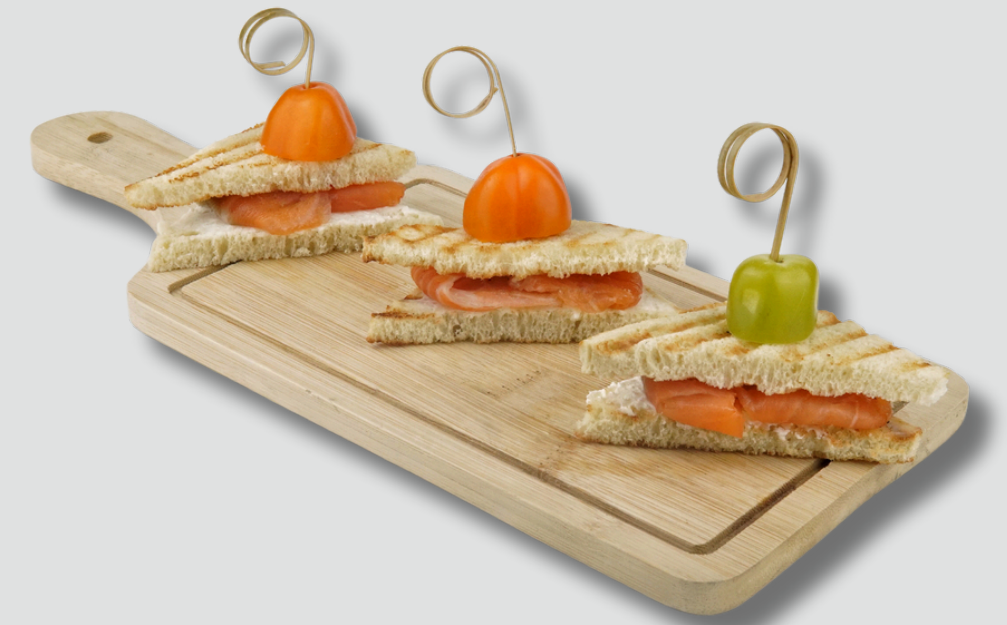
ლორითა და ყველით