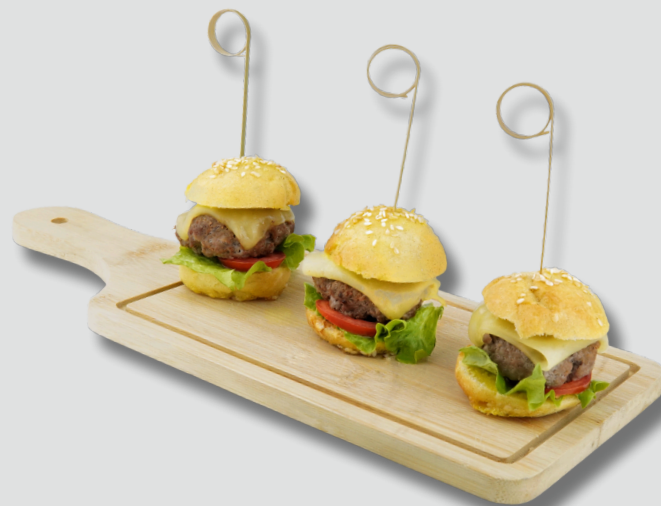
მინი ბურგერები ყველით