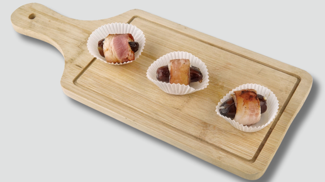
ფინიკით, ბეკონითა და ყველით