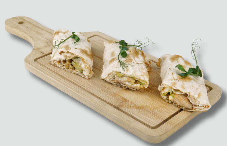
ქათმისა და ავოკადოს როლი