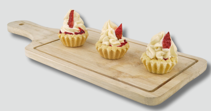
ტარტი მოხარშული კრემითა და კენკრით