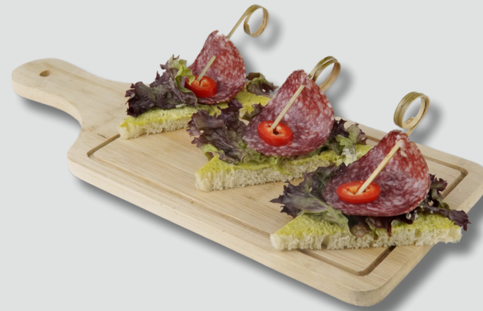
სალიამითა და კიტრის მწნილით