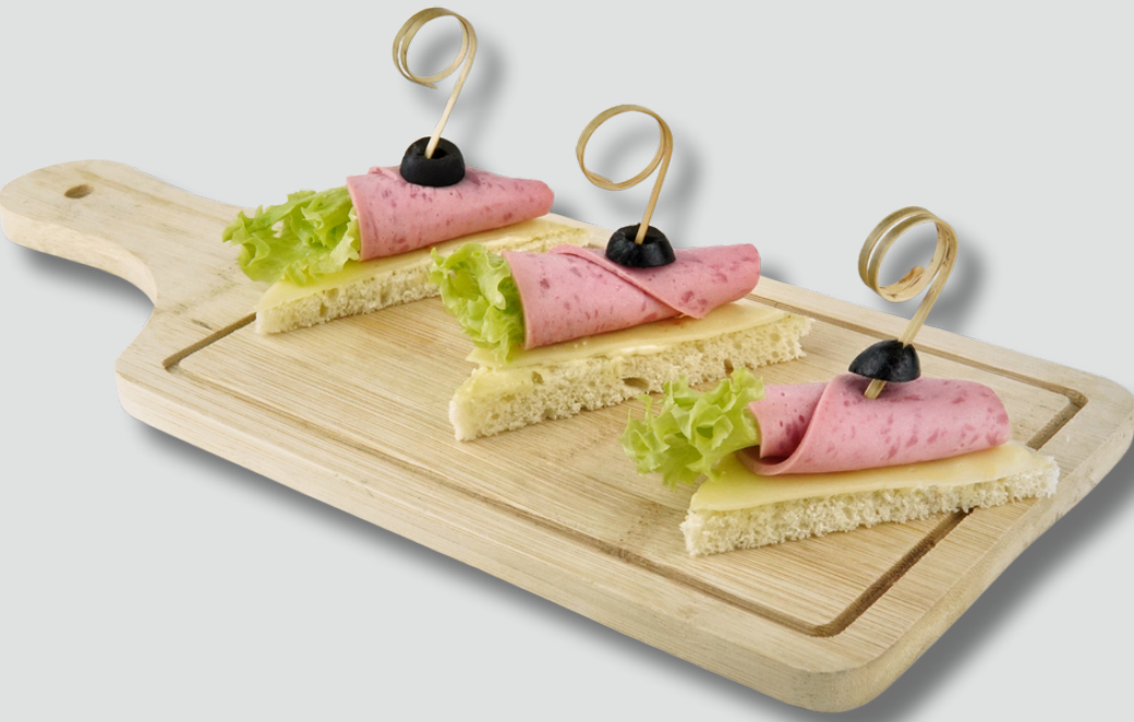
ლორითა და ყველით