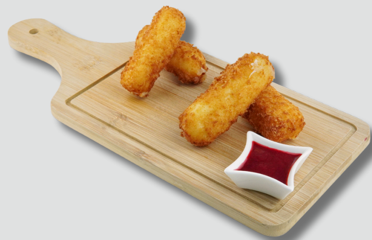
შემწვარი სულუგუნი კენკრის სოუსით